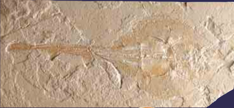
95 milyon yıllık keman vatozu fosili

Ele geçirilen keman vatozu fosilleri, hangi döneme ait olursa olsun, hep bir diğ erinin aynısıdır. Her türlü özelliğiyle günümüz keman vatozlarına benzeyen bu fosiller, canlıların küçük de ğ iş ikliklerle aş amalı olarak gelişt ikleri iddiasını yıkmaktadır. Allah tüm canlıları, bir örnek edinmeksizin, sahip oldukları mükemmel özelliklerle yoktan yaratmıştır.