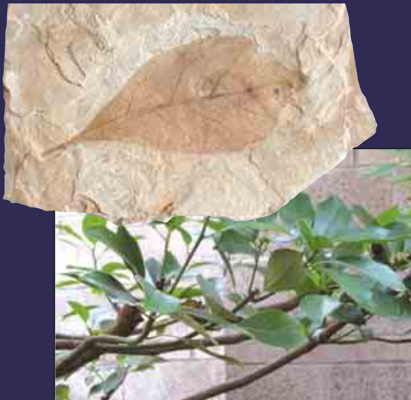
54 - 37 milyon yıllık defne yaprağı fosili