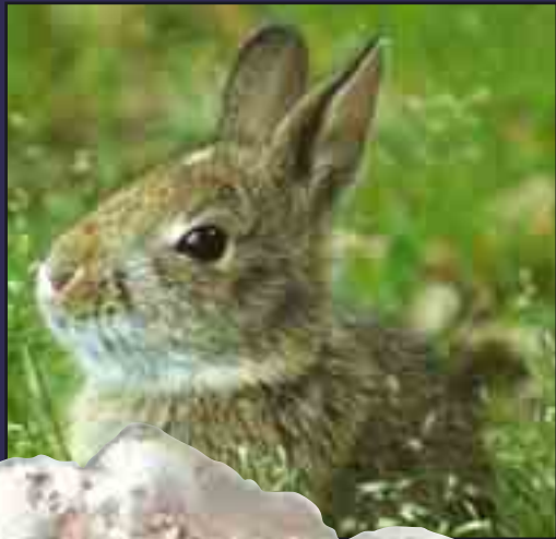
33 milyon yıllık tavşan fosili

Fosil kayıtlarında canlıların diğerk türlerden, aşama aşama oluştuklarını gösteren hiçbir örnek yoktur. Örneğın, milyonlarca fosil içinde bir tane bile yarı timsah yarı tavşan, ya da yarı yılan yarı tavşan özellikleri taşıyan canlı örneğı görülmemiştir. Ancak, tavşanların hep tavşan olarak var olduklarını gösteren binlerce fosil vardır. Fosillerin gösterdiği gerçek açıktır: Canlılar evrim geçirmemişlerdir, onları Allah yaratmıştır.