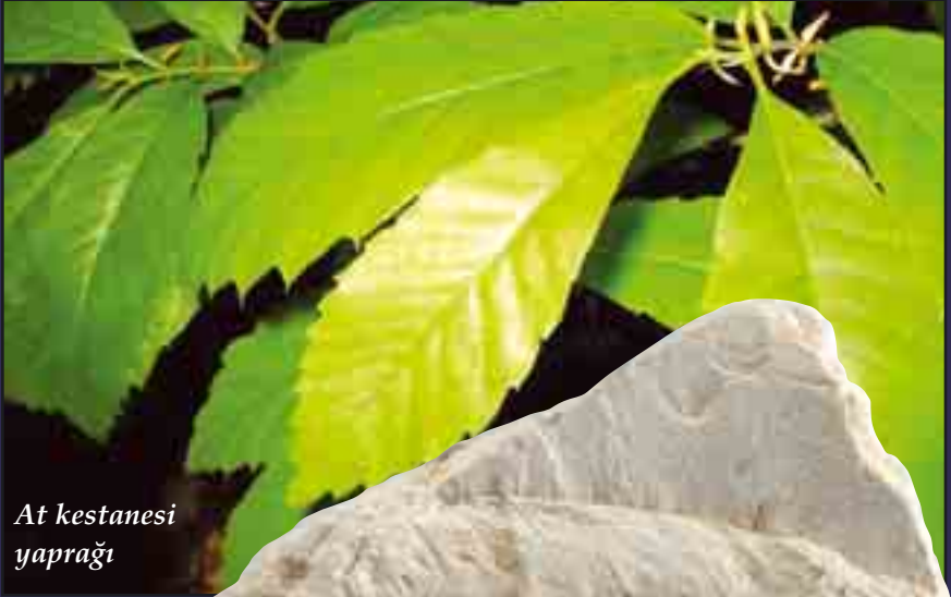
At kestanesi yaprağı

65 – 54 milyon yıl önceki at kestanesi yaprağıyla, günümüzde yaşayan at kestanesi ağacının yaprağı arasında hiçbir fark yoktur. Bu farksızlık, bitkilerin evrim geçirmediğini ortaya koyan delillerden sadece biridir. Bitkilerdeki her yapı özel olarak var edilmiştir. Bu da bize bu kusursuz sistemleri yapan üstün bir Aklın olduğunu gösterir. İşte bu üstün aklın sahibi Alemlerin Rabbi olan Allah, kusursuz yaratışının delillerini insanlara göstermektedir.