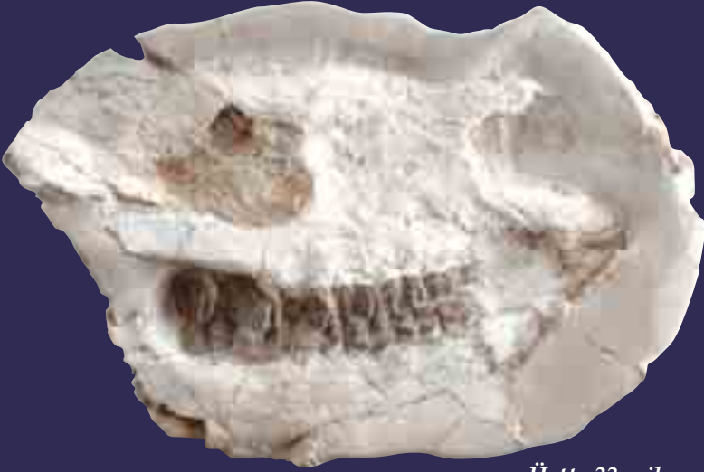
Üstte 33 milyon yıllık gergedan kafatası

Resimde görülen fosil, 33 milyon yıl önce yaşayan gergedanlarla, günümüzdeki gergedanlar arasında hiçbir fark olmadığını delilidir. Milyonlarca yıldır yapıları değişmeyen canlılar, evrim teorisinin büyük bir aldatmacadan ibaret olduğunu göstermektedir. Allah'ın üstün yaratışının izleri olan fosiller, evrimcilerin yalanlarını her geçen gün daha da güçlü bir şekilde deşifre etmektedir.