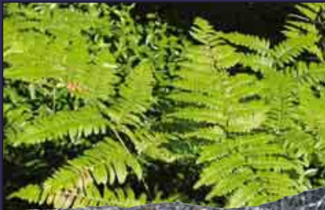
Günümüz eğrelti otu (yanda)