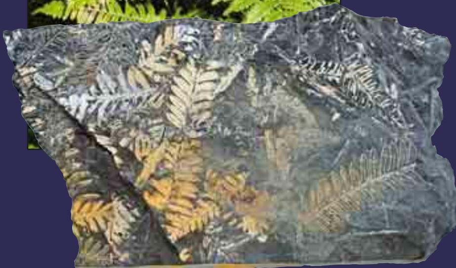
360 -286 milyon yıllık eğrelti otu fosili (altta)