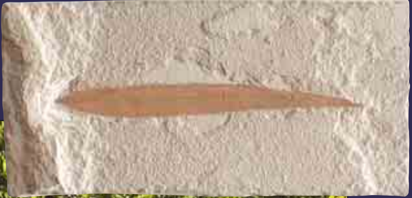
54 - 37 milyon yıllık söğüt yaprağı fosili